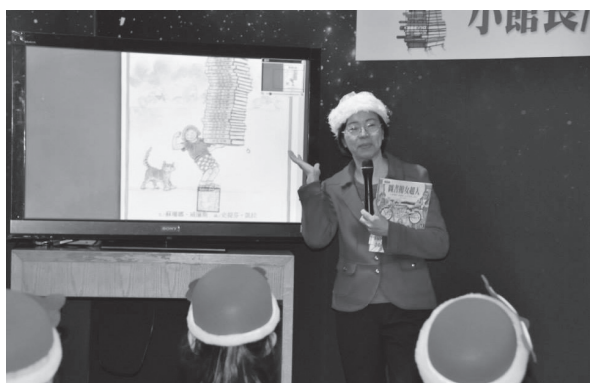
曾館長為小朋友述說了《圖書館女超人》的故事