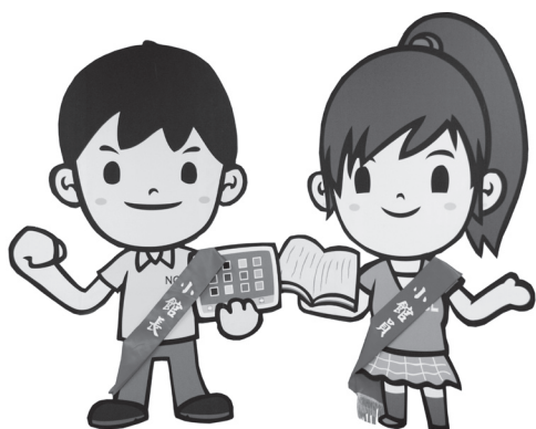
小館長／小館員的披肩綵帶