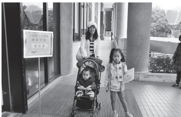
家長帶著小小朋友來到國家圖書館參加一日體驗活動

係，幼小孩童與兒童多需要家長陪伴，故於12月20日活動當日，國家圖書館總館及設於延平南路之藝術暨視聽資料中心均史無前例地開放讀者不限年齡、免辦證入館，對於未滿16歲尚無法申請國圖閱覽證的小讀者，是十分難得的機會，而且也紓解了辦證的擁擠人潮。