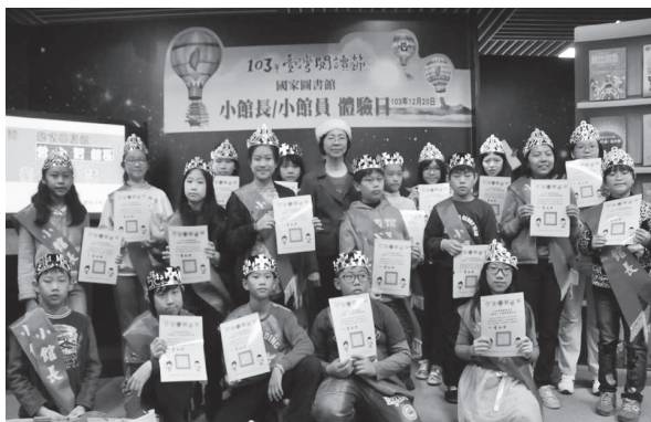
曾館長與完成結業的小館長們合影

活動最後，為嘉勉小朋友活動全程的努力學習參與，由曾館長為每一位小朋友加冕為館長，並頒發體驗活動的證書與聖誕節禮物，以資鼓勵。