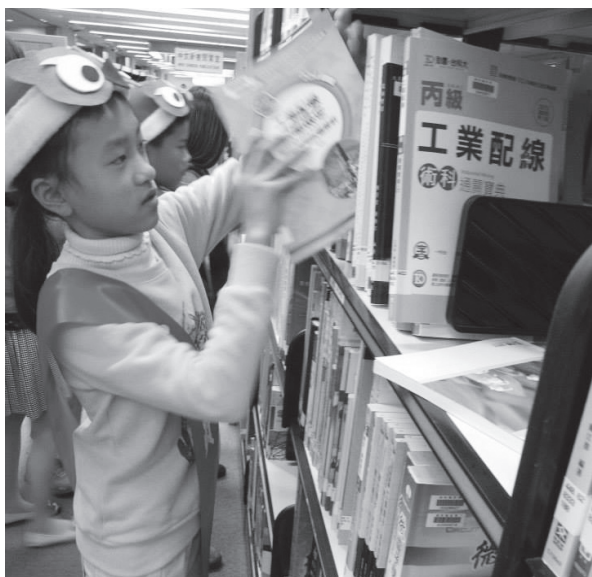
小館員學習圖書上架

館員，各學習站的館員也配合進行必要的指導，以便讓小朋友實際演練，並得以確保每一項工作操作的正確性。