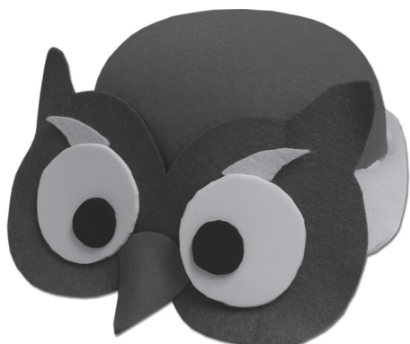
館員自製的象徵智慧的貓頭鷹帽