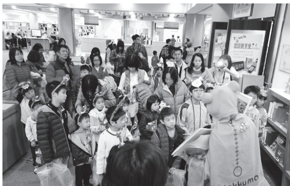
拉拉熊引導親子共覽圖書館

為了提供小朋友一個充滿知性之旅的圖書館體驗活動，除了說故事活動外，還安排了親子共覽圖書館導覽的活動。為了吸引小朋友們的注意，同仁還特別裝扮為拉拉熊，配合著趣味的問答與精心設計的大字板，引導這群小朋友與父母們參觀國家圖書館，親子共覽知識的殿堂。